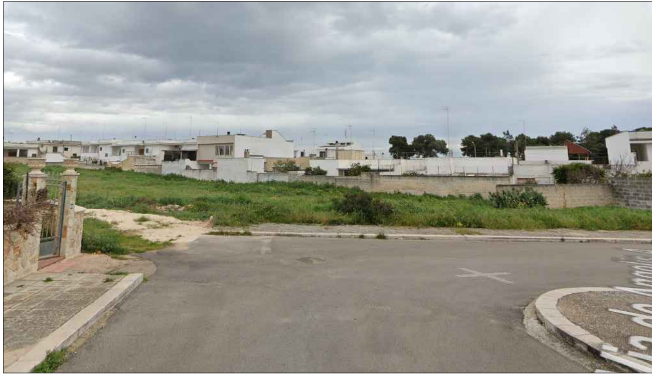
FOTOGRAFIA N. 1