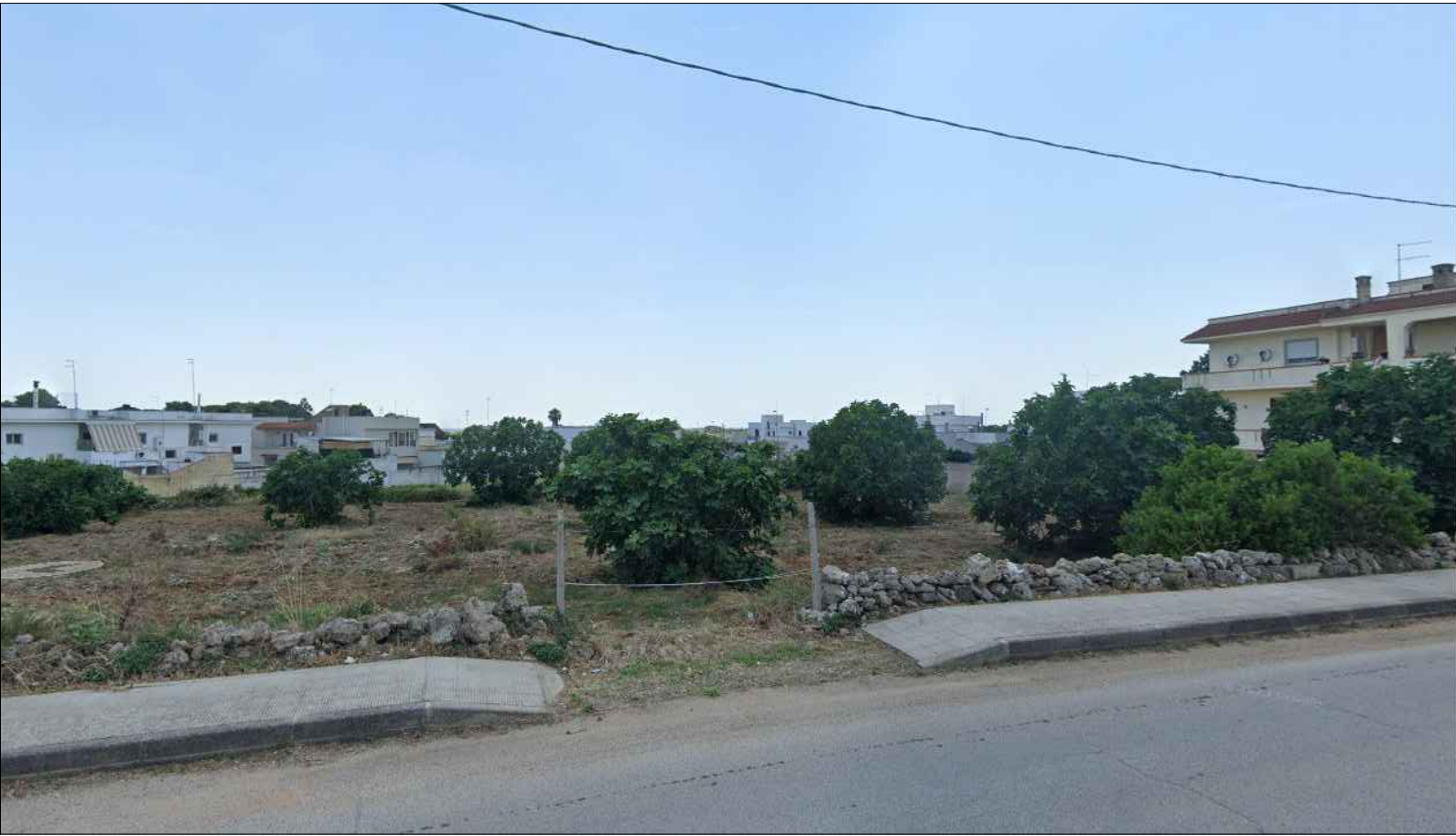
FOTOGRAFIA N. 4