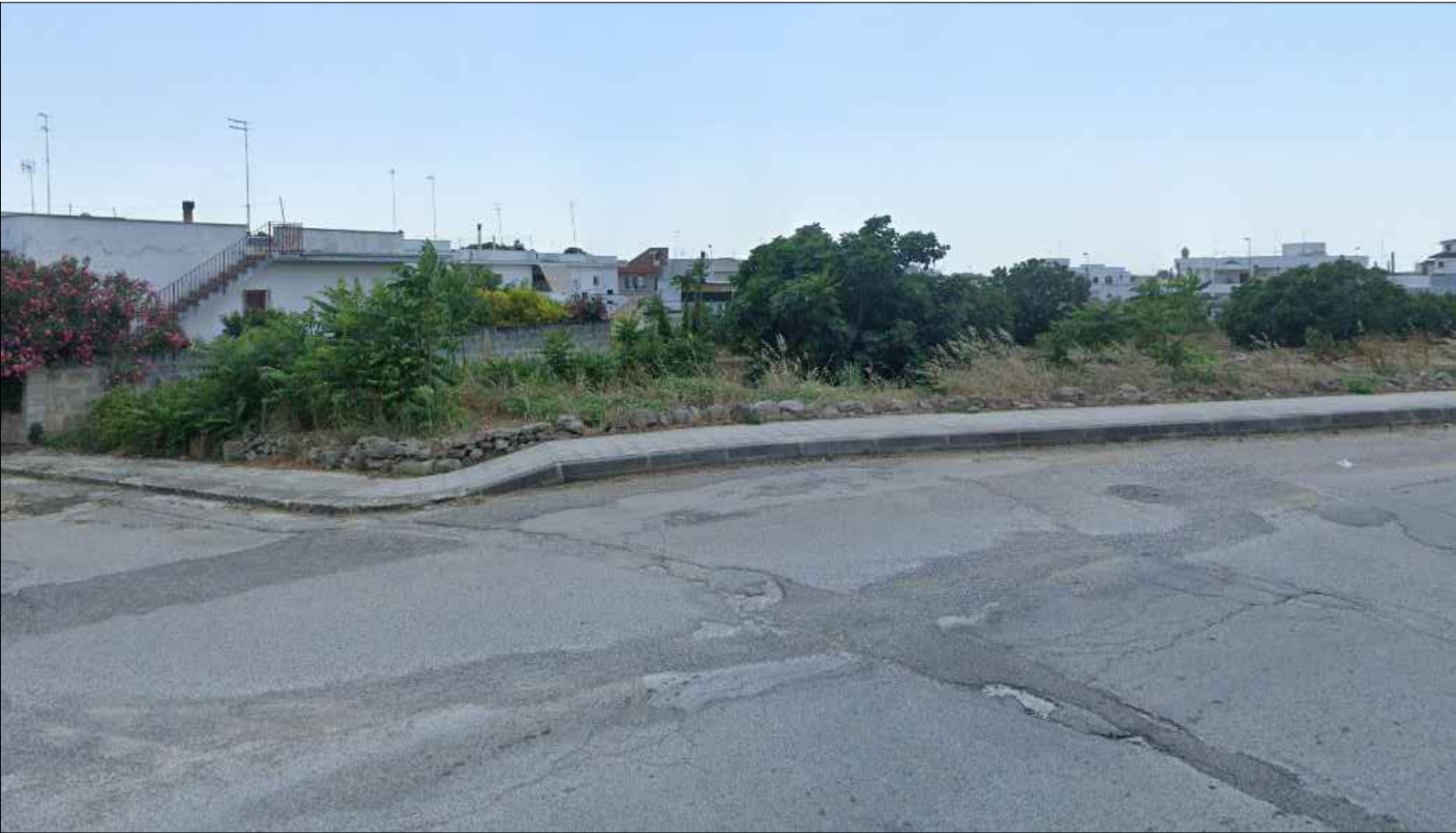
FOTOGRAFIA N. 3