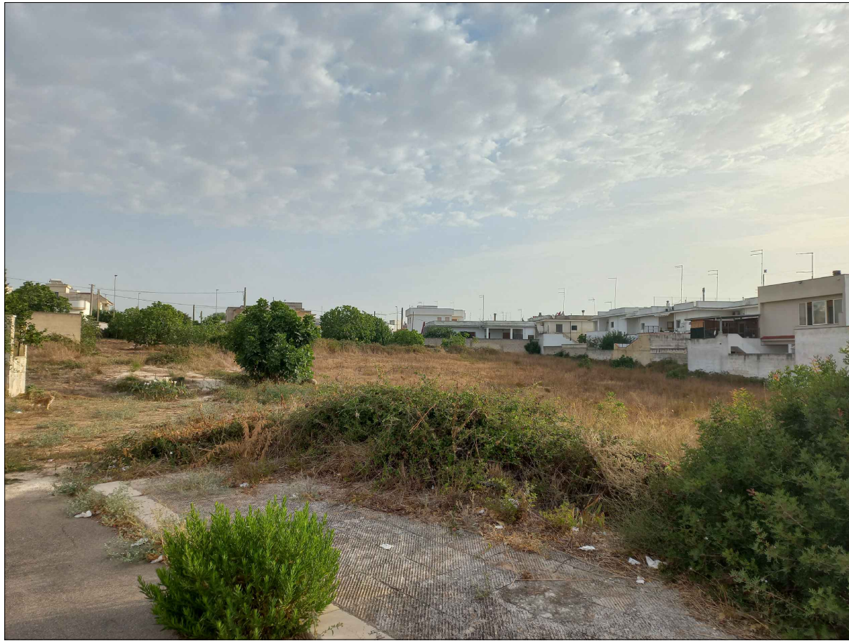
FOTOGRAFIA N. 2